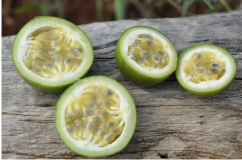
Maracujá BRS Pérola do Cerrado

O maracujá silvestre BRS Pérola do Cerrado está chegando às gôndolas da rede Oba Hortifruti. O grupo varejista irá organizar uma degustação dos frutos em suas oito lojas de Brasília-DF nesta segunda-feira (14). Em sete lojas a degustação ocorre das 10h às 16h e no Sudoeste das 16h às 22h. O novo maracujá será comercializado em embalagens de 450 gramas rotuladas com o selo "Tecnologia Embrapa". Quem também aposta na qualidade do novo maracujá é a Sorbê sorvetes artesanais. A sorveteria lançou no último dia 5 o sabor "Maracujá do Cerrado".